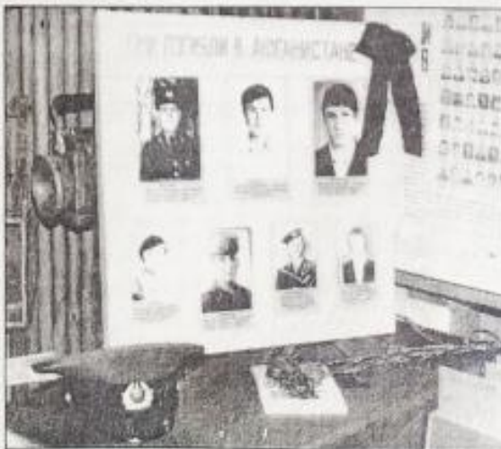
Изображение 20. Один из первых материалов, вновь открывших тему Афганистана для читателей Болотнинского района после того, как в начале 1990-х болотнинские публикации о земляках-афганцах были прекращены. (Панчева Г.Нас уже забывают.../ Г.Панчева // Наши новости. - 22 февраля 2001. - С.1.)

16 февраля, благодаря комитету по делам молодежи, работникам музея, состоялась встреча бывших солдат афганской и чеченской войны.